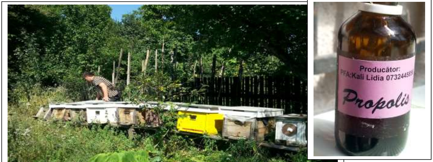
De bijenkasten in Székes

Lidia maakt ook medicijnen uit deze honing.( Propolis), verkrijgbaar in o.a. natuurwinkels.